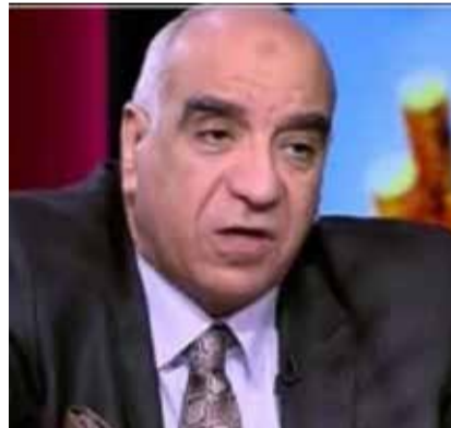
اللواء محمد نور الدين

وقد تم التباحث أيضا بشأن سبل تعظيم التعاون بين مصر وفرنسا في مجال مكافحة الإرهاب والفكر المتطرف، خاصة في منطقة الساحل الأفريقي، ودعم جهود دول تلك المنطقة في مواجهة خطر تمدد الجماعات الإرهابية وتزايد نشاطها هناك، خاصة بعد دحرها في منطقة الشرق العربي وشمال أفريقيا.