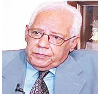
اللواء جمال مظلوم

صرح السفير بسام راضي، المتحدث الرسمي باسم رئاسة الجمهورية، بأن اللقاء شهد متابعة عدد من الموضوعات ذات الصلة بالعلاقات الثنائية الاستراتيجية بين مصر وفرنسا، وكذلك تبادل