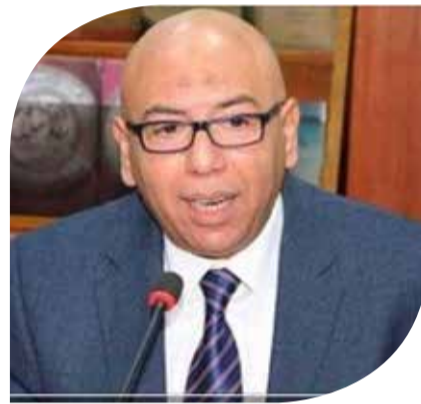
العميد خالد عكاشة